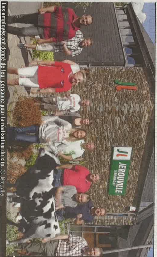
Les employés ont donné de leur personne pour la réalisation du clip.